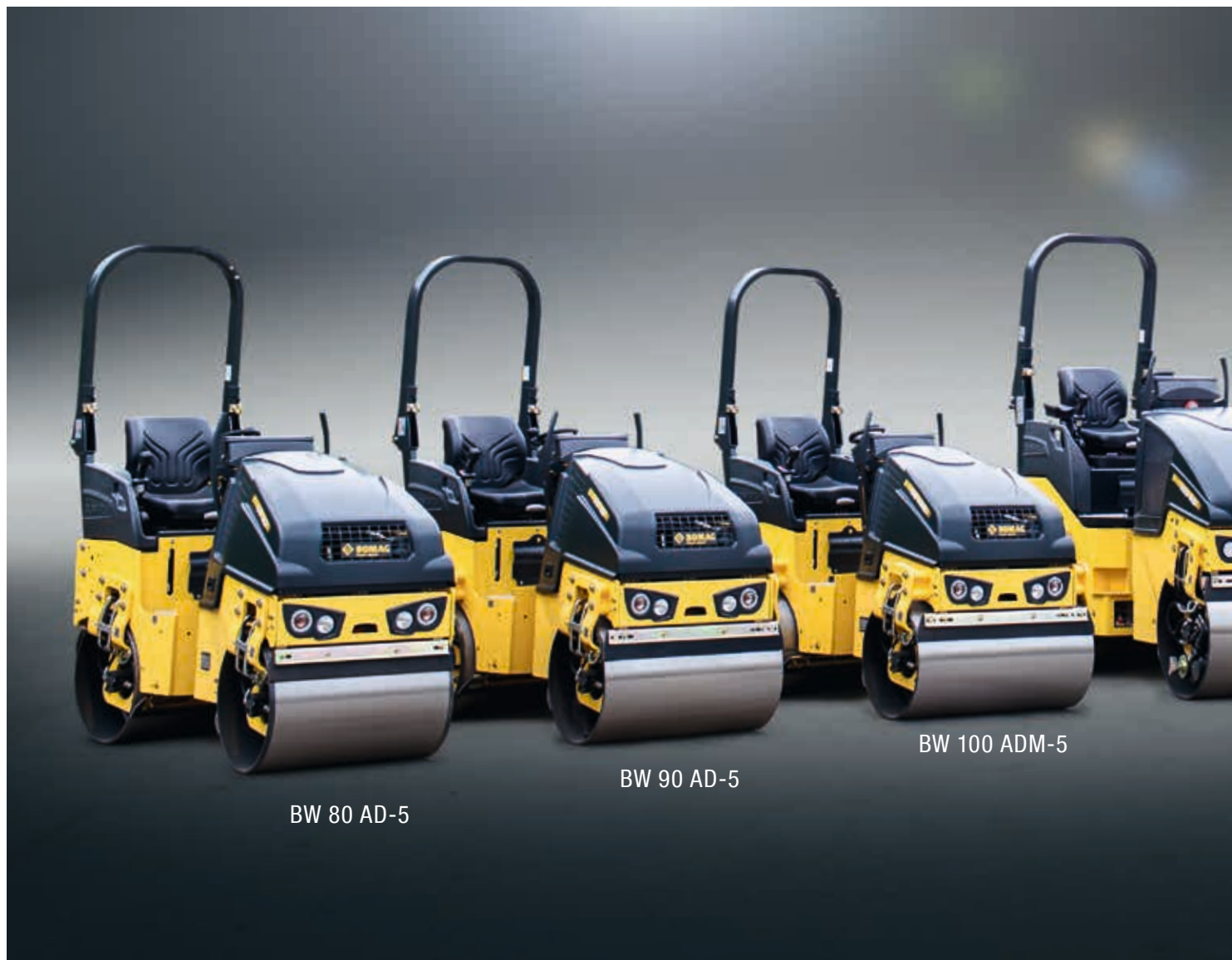
BW 80 AD-5