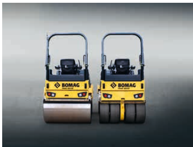
BW135/138 : les poids lourds de 3,9 à 4,3 t.