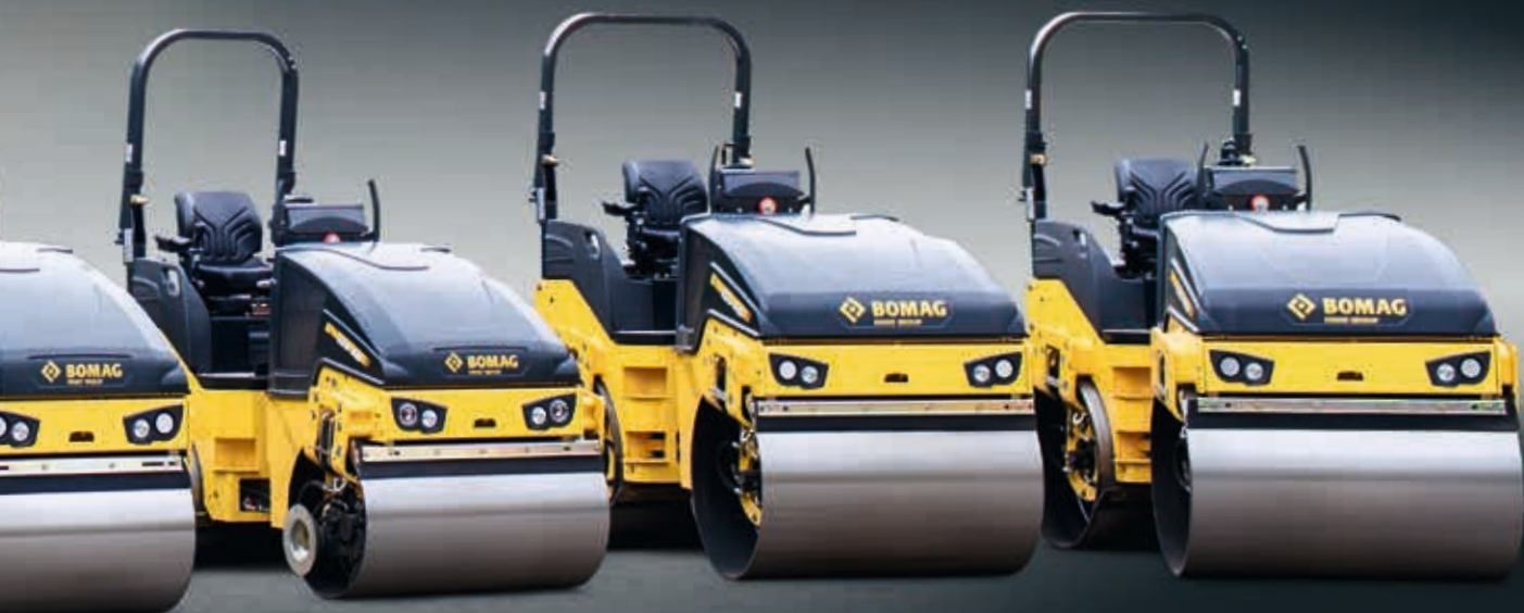
BW 100 AD-5