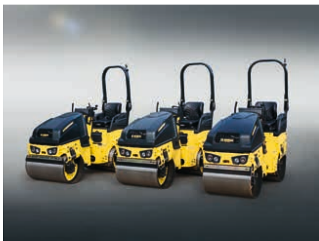
BW80/90/100 : les poids plumes jusqu'à 1,8 t.