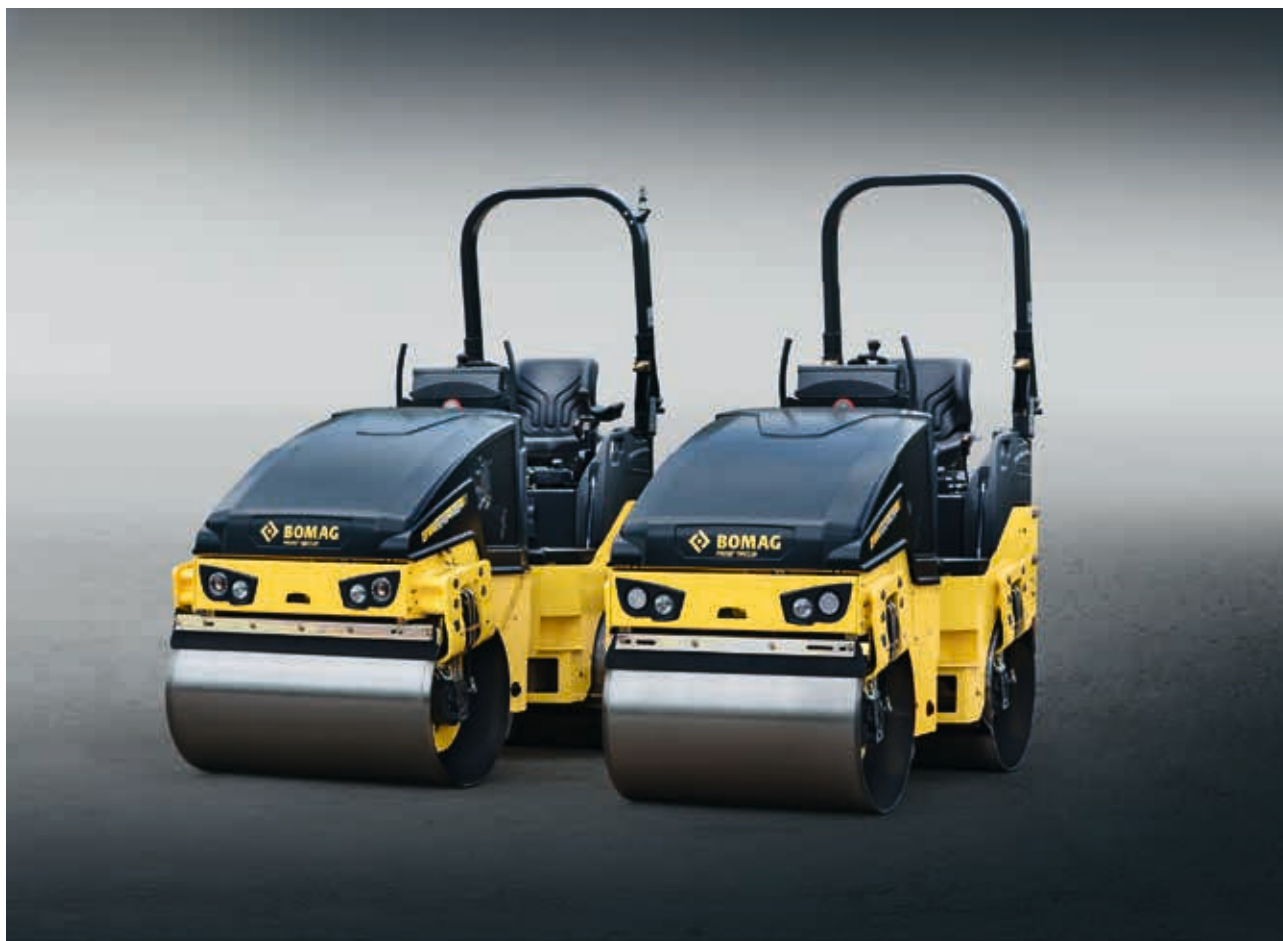
BW100/120 : les universels de 2,3 à 2,7 t.

BOMAG vous propose la machine idéale pour chaque usage. Choisissez parmi les 14 modèles le rouleau et l'équipement qui vous correspond le mieux, à vos usages et votre entreprise.